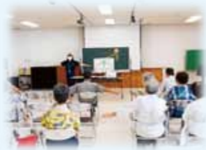
高齢者に対する交通安全教育