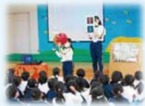
幼児及び児童に対する交通安全教育