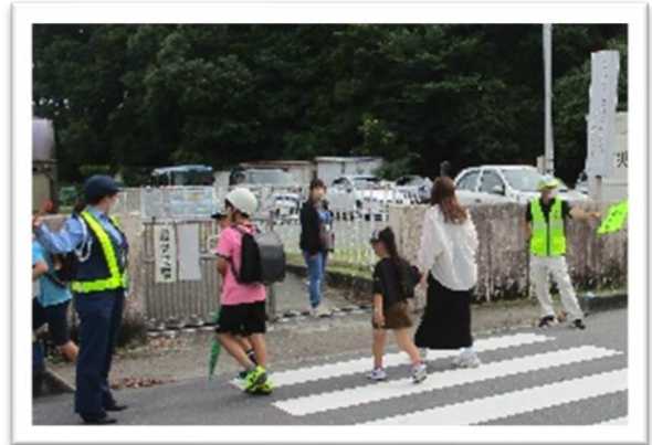
☆下校時見守り活動☆