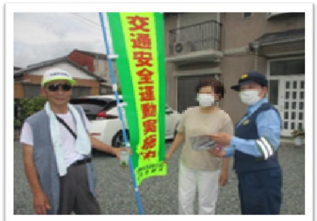
☆幸支部高齢者宅訪問☆