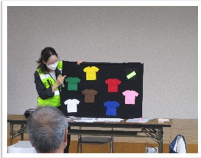
☆花岡地区市民センターで高齢者交通安全教室☆

夏の交通安全県民運動（7月11日～20日）に伴い、様々な活動で交通安全を呼びかけました。