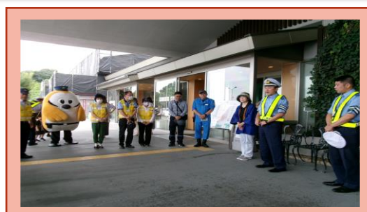
【四日市名物を使った広報啓発】