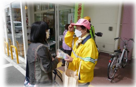
【大型店舗前で反射材を配布しました。】