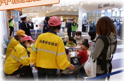
【子どもたちに交通安全キーホルダーの作成を行いました。】