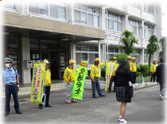
【市内高校で自転車啓発活動として、ヘルメット着用 の声掛けを行いました。】