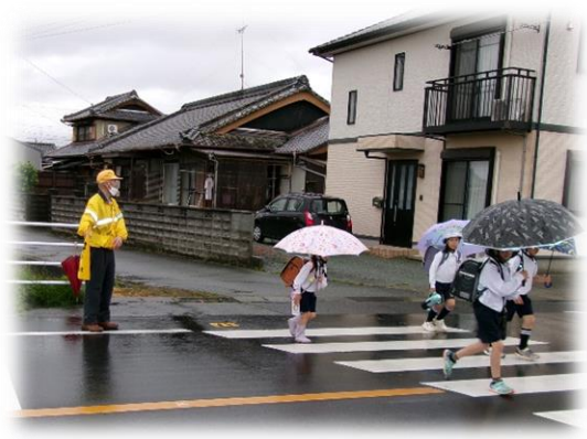
【子どもたちの登下校を見守りました。】